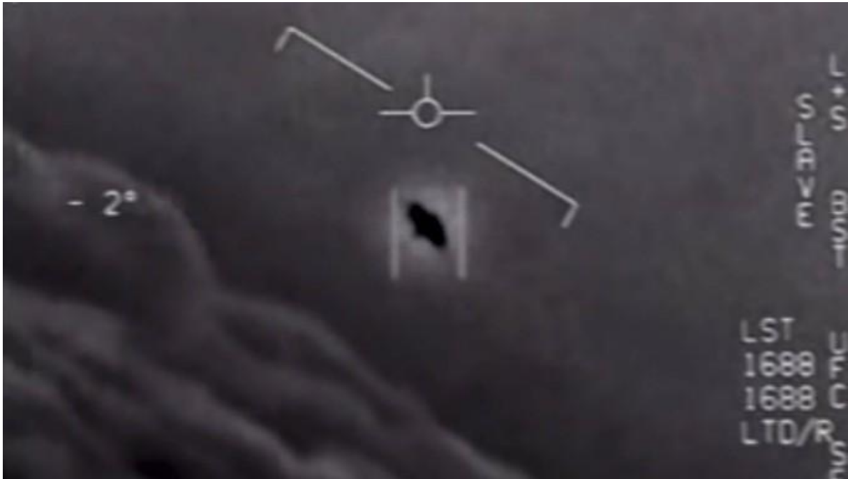
(Ausschnitt aus einem der Pentagon-Videos, das ein Kampffjet Jahre zuvor bei einem Einsatz gefilmt hatte.)

Umso mehr überraschte im Jahr 2020 das amerikanische Verteidigungsministerium – das Pentagon –, als es drei bis dahin geheim gehaltene Videos von Kampfpiloten veröffentlichte 2 . Diese Videos zeigen Objekte, die es nicht identifizieren und deren Flugverhalten es technisch nicht erklären konnte. Sie waren der eigenen Technologie weit überlegen.